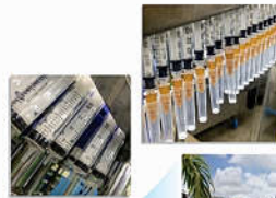
Unidade fabril Manaus - Amazonas - BR