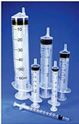
Calibre das seringas

Êmbolo deslizável, ajustado ao corpo da seringa, de modo a impedir a entrada de ar e vazamentos, com anel de retenção de borracha fixado em sua extremidade. Pode ser apresentada com agulha e com Protetor de segurança SR32.